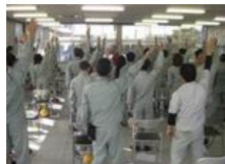
《成人病予防セミナー》